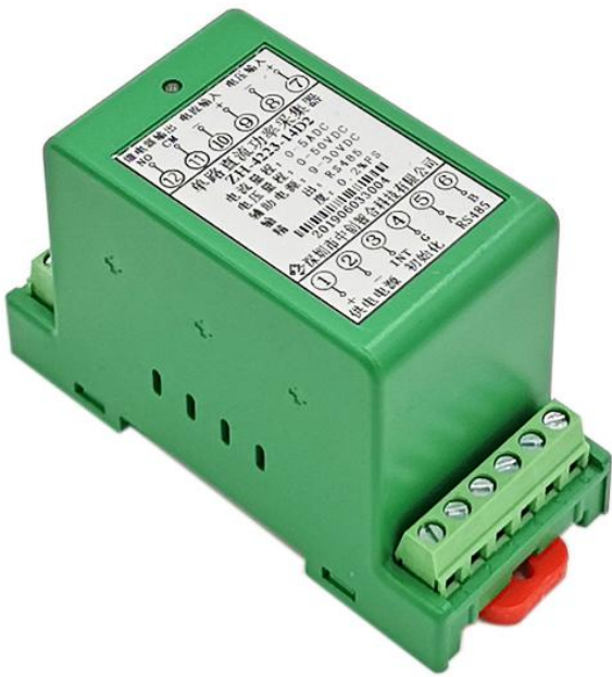
图 4.1、外观图（导轨安装）