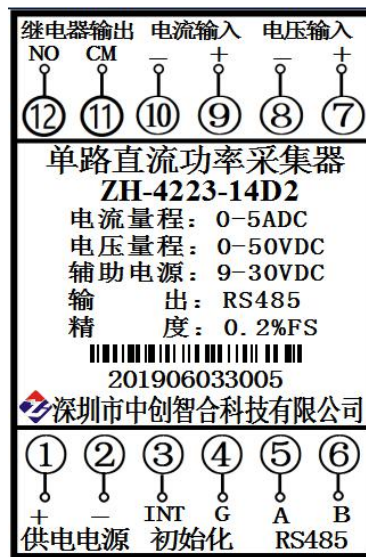
图 5.1、产品接线参考图